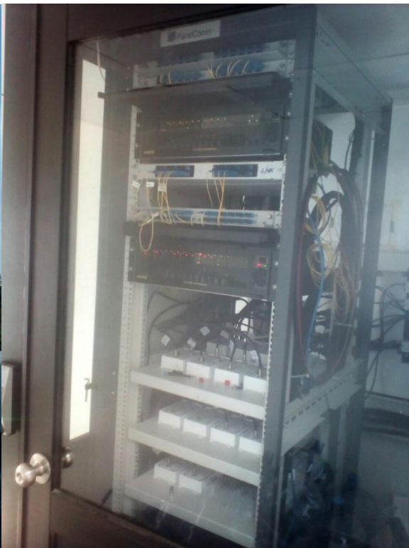
งานรับสัญญาณดาวเทียมขนาด 4.7 เมตร